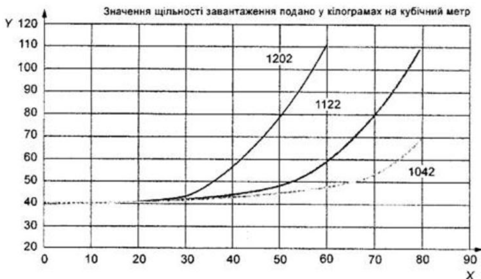
Рисунок 1 - Залежність «температура-тиск» для вогнегасної речовини HFC 236fa, над якою за температури 22 °C за допомогою азоту створено надлишковий тиск 25 бар