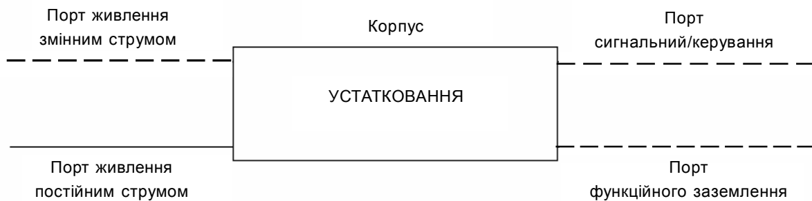
Рисунок 1 — Порти устаткування